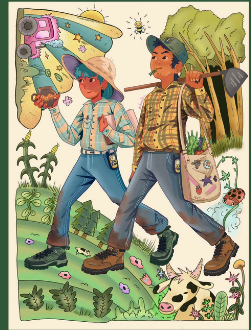
Dibujo de Camila Varela Egresada de Agroecología 2022

Análisis de la estructura social, a través de caracterizar las redes de autoapoyo involucrados en la autogestión comunitaria para el diseño e instrumentación de la gestión participativa de los recursos comunitarios con equidad y justicia social.